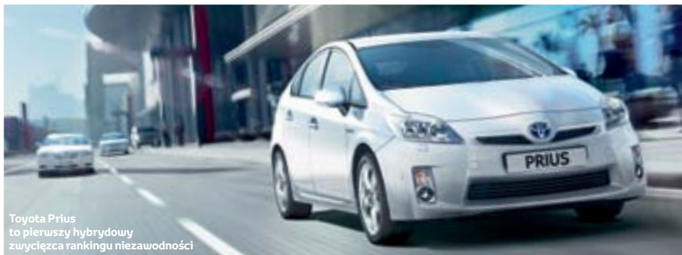
Toyota Prius to pierwszy hybrydowy zwycięzca rankingu niezawodności

Segment kompaktów jest w całości opanowany przez modele Toyoty, które zajmują pierwsze miejsca we wszystkich kategoriach wiekowych.