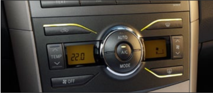
• KLIMATYZACJA AUTOMATYCZNA