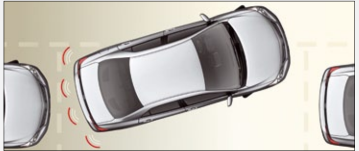
• CZUJNIKI COFANIA