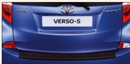
Listwa ochronna na tylny zderzak