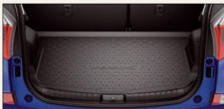
Gumowa wykładzina bagażnika