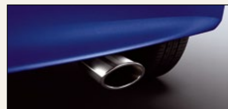
Końcówka rury wydechowej