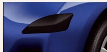
Nakładki ochronne na narożniki zderzaków