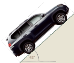
Zdolność pokonywania wzniesień