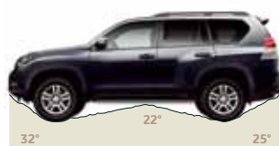
Kąty natarcia, rampowy i zejścia