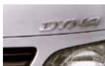
srebrny metalik (199)