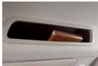
Półka pod sufitem