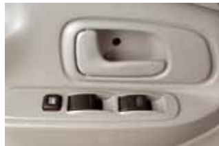
Elektrycznie regulowane szyby