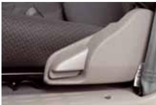
Siedzenie kierowcy przesuwane do przodu i do tyłu z regulacją pochylecia oparcia

1 Podana cena dotyczy pakietu Optimum na rok i obowiązuje tylko do dnia wydania nowego auta z salonu Toyoty. Szczegóły programu dostępne u Dilerów Toyoty lub na www.toyota.pl